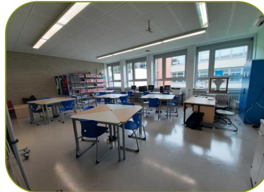
FEG, Raum A002