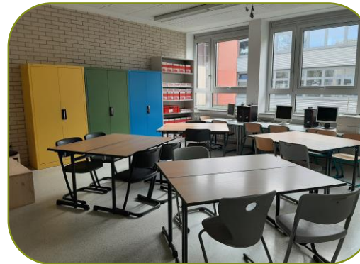
FEG, Raum A003

Am FEG wurden zwei Räume zur Lernwerkstatt umgebaut und ausgestattet. Wir führen dort unsere Workshops mit den Klassen durch. Ausgestattet sind die Räume mit PCs, vorbereiteten Workshopkisten, und anregendem Material. Flexible Sitzarrangements ermöglichen einen bewegungsaktivierten Unterricht.